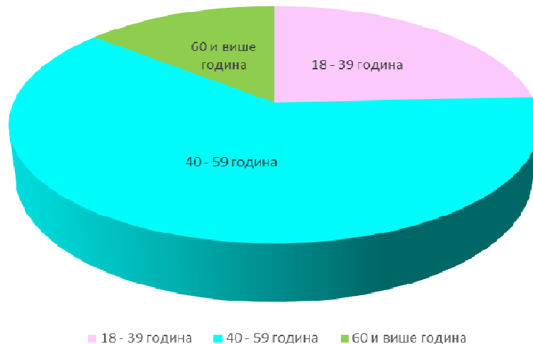
СТАРОСНА СТРУКТУРА (године стално запослених државних службеника на извршилачким радним местима)